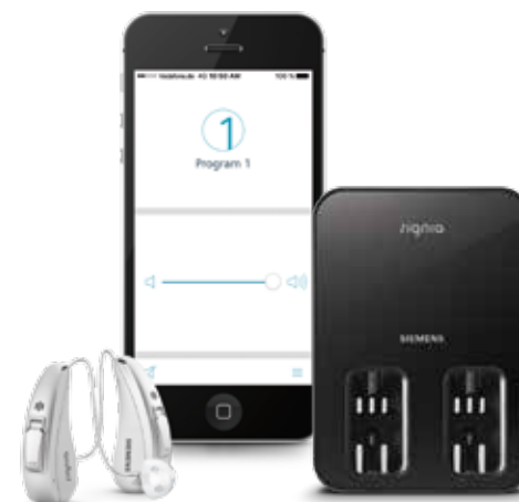
Cellion touchControl-App Induktiv-Ladestation